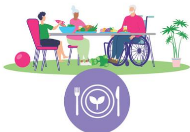
Ravinto ja ruokailu

Syötkö hyvin? Söitkö rauhassa vai oliko kiire?