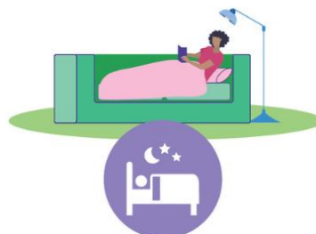
Lepo ja rentoutuminen

Saatko nukuttua tarpeeksi? Ehditkö rentoutumaan?